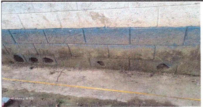
Foto 3: Paredes de las tres aulas dañadas y eso causa humedad en las aulas en el módulo 1 en parte exterior.