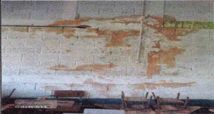
Foto 1: Se observa el deterioro de la estructura, desprendimiento pinturas en las paredes en el módulo 1.